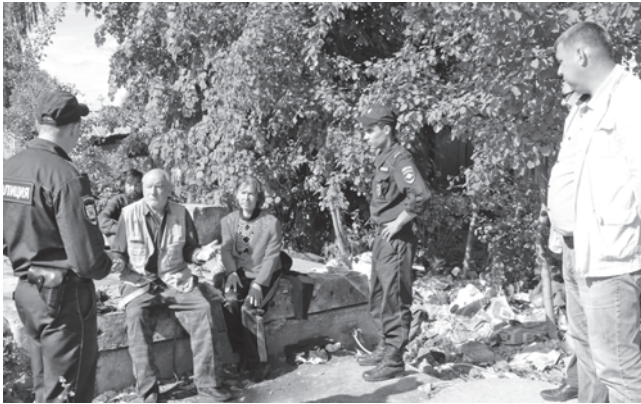
Совместный рейд с депутатами городского Муниципального совета по проверке тревожных сигналов с улицы Шишкина обернулся "задержанием с поличным".

Если бы не письмо от обеспокоенных горожан, то мы бы и до сего дня, наверное, не знали, что буквально в центре Гаврилов-Яма располагается одно из самых зловонных мест города. И это по соседству с двумя школами – первой и шестой – филиалом РГАТУ и баней.