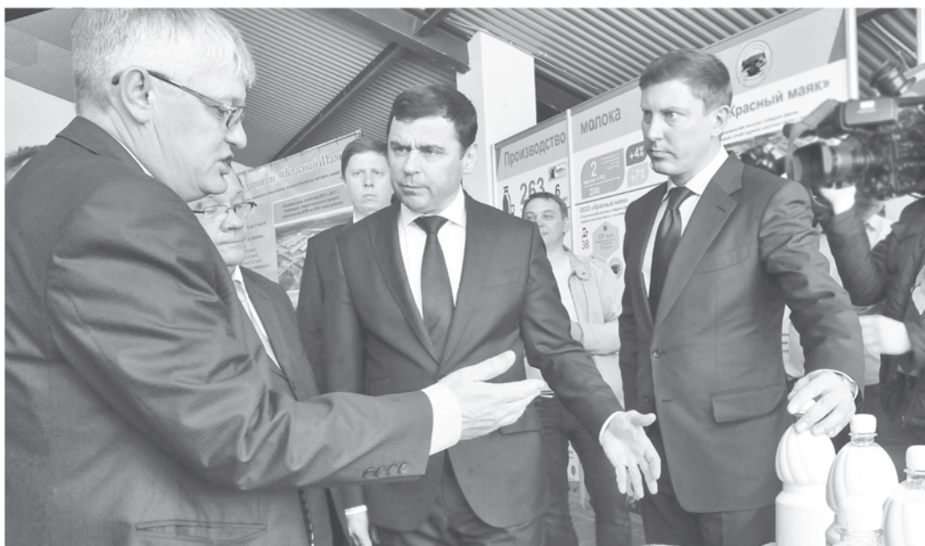
Рабочая поездка главы региона на сельхозпредприятие «Красный маяк»

Новые меры господдержки: упрощенное предоставление сельхозземель инвесторам и субсидии – 2 тысячи рублей за каждый гектар введенной в сельхозоборот земли, – дают первые результаты. Во время рабочей поездки в Ростовский район Дмитрий Миронов побывал в «Агрохолдинге «Истра». Сельхозпредприятие планирует засеять в этом году 5 тысяч гектаров. В следующем руководству агрохолдинга надеется ввести в оборот 10 тысяч гектаров. Соглашение с новым инвестором было подписано на XVIII Российской агропромышленной выставке «Золотая осень». Она оказалась на редкость урожайной для региона. Правительство Ярославской области подписало договоры с общим объемом инвестиций порядка 5 млрд рублей, в том числе и в новом направлении – аквакультуре. В частности, Институт агроэкологии и биотехнологии