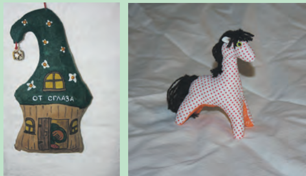
Автор: Попова Ирина Александровна.

Завершился прием фотографий на конкурс поделок «ОЧУМЕЛОЕ КОПЫТЦЕ». Результаты состязания будут подведены в ближайшее время.