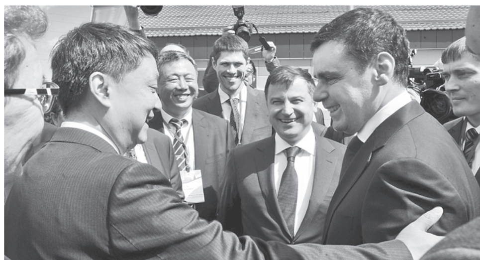
На открытии совместного российско-китайского проекта

В Ярославской области введена в эксплуатацию Хуадянь-Тенинская ТЭЦ. Это крупнейший инвестиционный энергетический проект, реализуемый Китаем в России, ТЭЦ не имеет аналогов в стране. Экономия топлива – природного газа – составит примерно 25 процентов. На треть должны снизиться объемы выбросов в атмосферу.