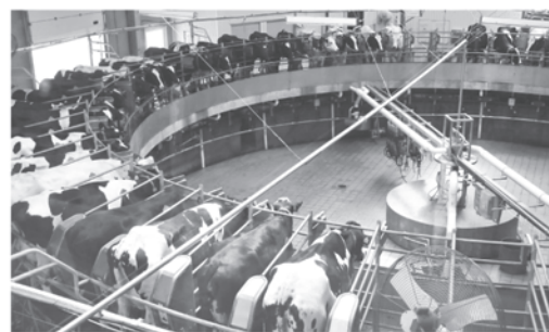
Первая в области доильная установка карусельного типа

Правительство региона активно реализует проект поддержки крестьянско-фермерских хозяйств – «Ярославский фермер», способствуя расширению рынков сбыта. По проекту до 2018 года в регионе будет создано 20 торговых точек для реализации фермерских продуктов. По мнению главы региона Дмитрия Миронова, этот опыт необходимо распространить за пределы области и открывать фермерские лавки в столичных магазинах.